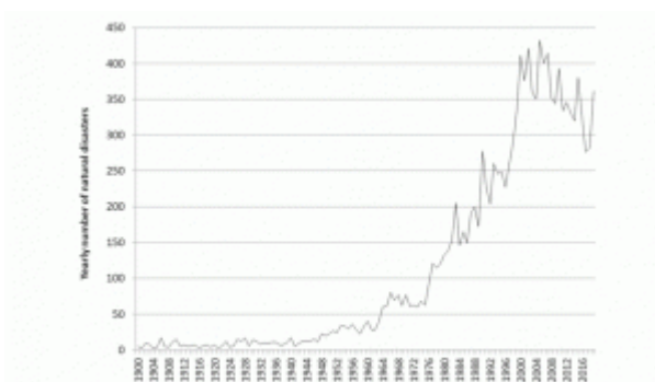
Fig. 8 Diagram of the number of natural disasters from 1900 to today

Seit dem Jahr 2000 gibt es weniger Extremwetter.